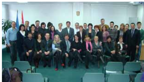
Delegati Osnivačke skupštine HKZR-a

Na Osnivačkoj skupštini usvojen je Statut Komore te izabrano Predsjedništvo i Vijeće Komore na mandat od četiri godine.