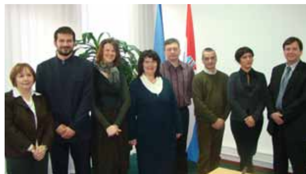
Članovi Vijeća HKZR-a